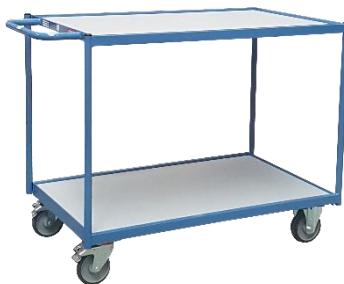
Servante 1 poignée horizontale CU 250 kg