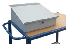
882 006 039 Pupitre à poser avec écrioire verrouillable 440 x 520 mm.