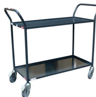
Servante plateaux tôle CU 200 kg